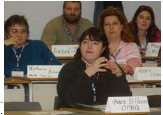
L'atelier Loisir et personnes handicapées.