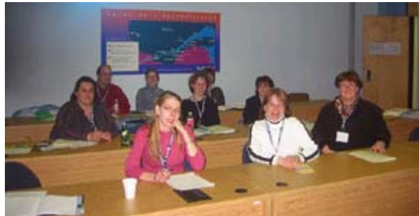
Les participants de Rimouski.

des expériences et des réflexions sur le rôle des travailleurs ou des bénévoles et de nous outiller afin que les actions des intervenants en loisir puissent favoriser l'accessibilité au plus grand nombre ».